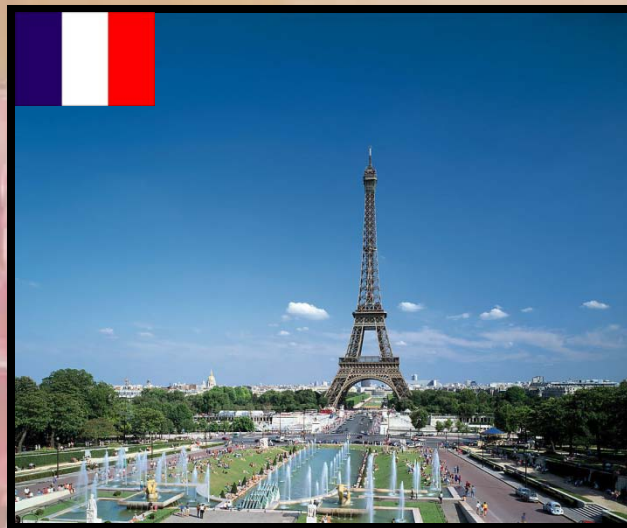
法国 fǎ guó