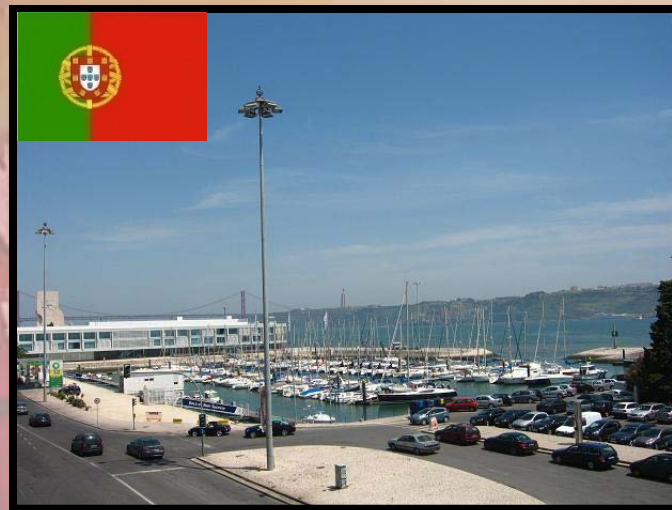
葡萄牙 pú táo yá