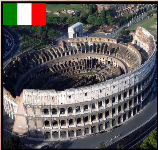
意大利 yì dà lì