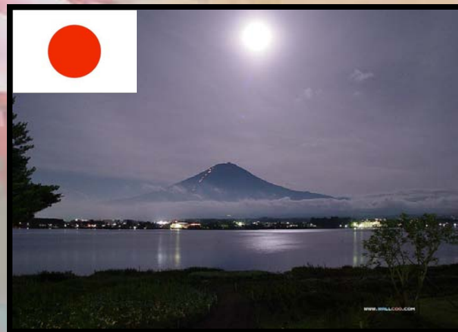
日本 rì běn