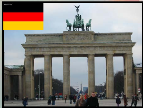
德国 dé guó