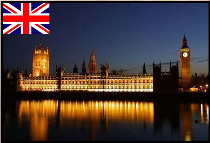
英国 yīng guó