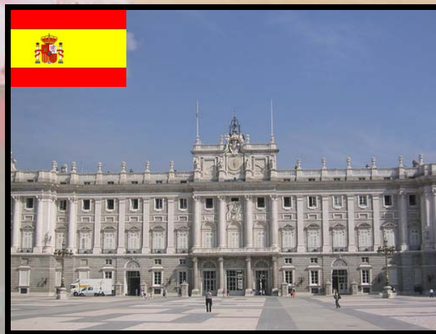
西班牙 xī bān yá